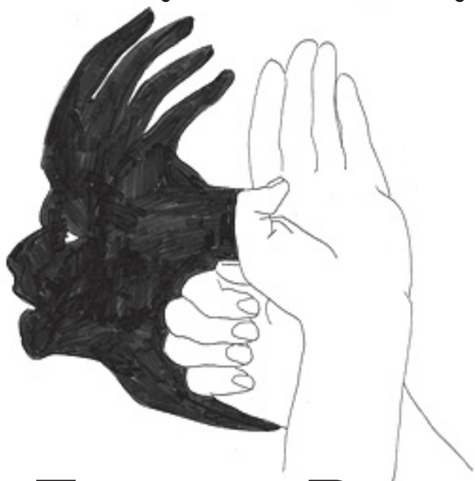
Treat (or Trick) • 2009.